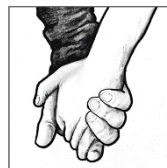
Zweiter Advent: Freundschaft